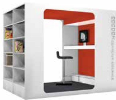
Cocoon Computer-Lounge L

Afhankelijk van de keuze van het model, kunt u de buitenkant gebruiken voor presentatie op het hoogglans eindpaneel of u kunt legborden, lades en andere functies van het Ratio rekensysteem gebruiken.