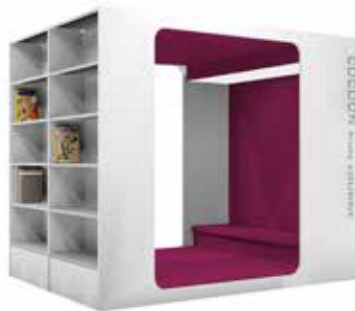
Cocoon Kids-Lounge L

Er zijn twee modellen beschikbaar – L en XL – al naargelang of er zitplaatsen aan beide zijden nodig zijn. Voeg graphics toe aan de buitenzijden van de lounge om de juiste sfeer te creëren.