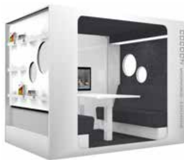
Cocoon Working-Lounge Exclusive

Creëer een zone voor studenten en werkgroepen met de Cocoon Working-Lounge.