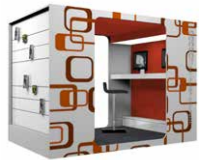
Cocoon Computer-Lounge XL