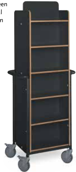
DISPLAYWAGEN XL PLUS

Functionele enkelzijdige boekenwagen met drie vaste, schuin geplaatste planken. Capaciteit : Ca. 100 boeken (normale grootte). Afmetingen : B1010 x D350 x H1090 mm